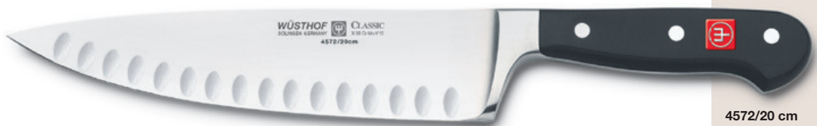
Abb. zur Veranschaulichung seitenverkehrt. Abstreifer und Ätzung auf rechter Seite. Picture reversed for illustration purposes. Ridge and etching are on the right side of the blade.

gelocht, mit Abstreifer with deflecting ridge