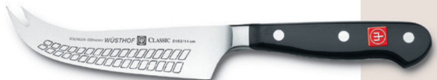
3103 (14 cm)