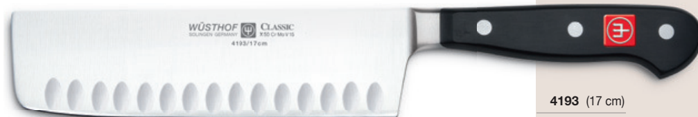
mit Kullenschliff with hollow edge