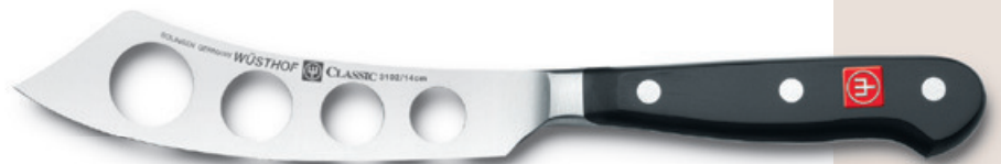
3102 (14 cm)