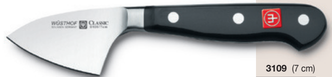
3109 (7 cm)

Käsemesser cheese knife couteau à fromage cuchillo para queso coltello formaggio